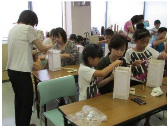
夏休み子ども体験「ミニ灯笼を作ろう」 博物館体験学習室にて