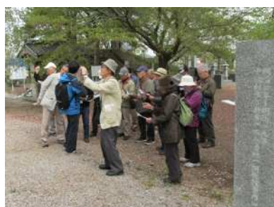
野外博物館教室 「江戸時代の村を歩く 中福村」