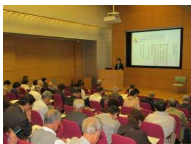
博物館歴史講座 「柳沢吉保とその時代」