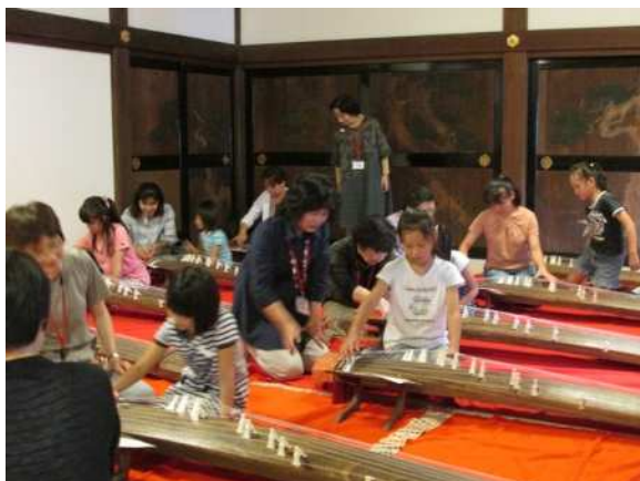
子ども体験教室「和楽器体験」 本丸御殿にて