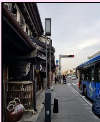
オ 街灯 (がいとう)