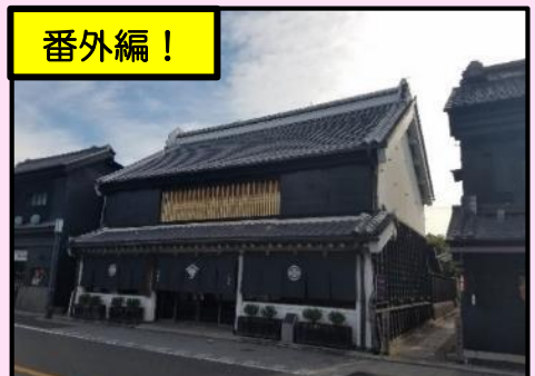
番外編！ コ 川越に蔵造りの建物が増えるきっかけとなった「大沢家住宅」