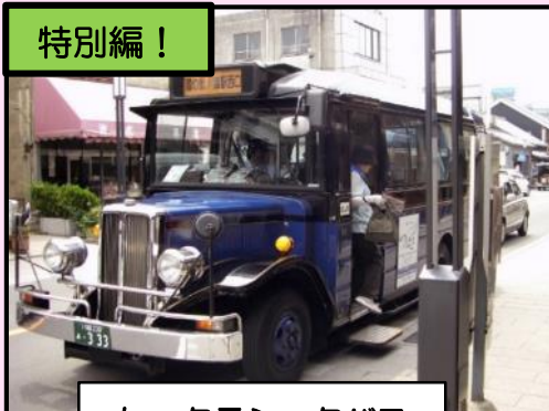
ケ クラシックバス