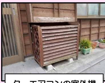
ク エアコンの室外機